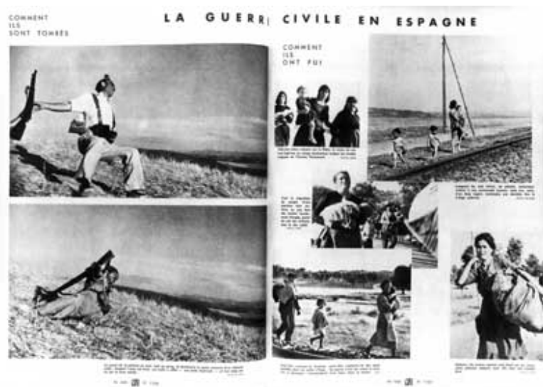
VU n. 445 pagg. 1106-1107 del 23 settembre 1936

La ricerca sarebbe stata più facile se la citata rivista "VU" non avesse pubblicato, sulla stessa pagina, due foto di due miliziani che cadono sullo stesso metro quadrato di terra e, in nessuna delle due, si vede il corpo del soldato caduto per primo.